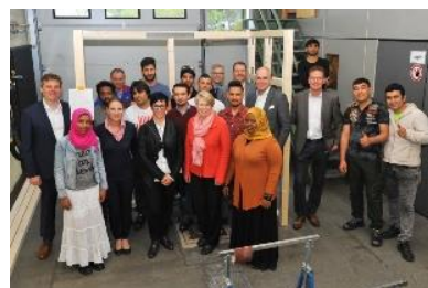
Bau der Give – Box für Melsungen

dienstags in der Zeit von 9:00 bis 16:00 Uhr zur offenen Beratung (in den Schulferien auf Anfrage).